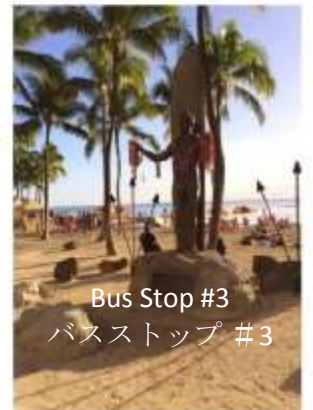
Bus Stop #3 バスストップ #3

Duke Statue on Kalakaua Ave. across from Hyatt Regency Waikiki デュークカハナモク像前、カラカウア通り沿い