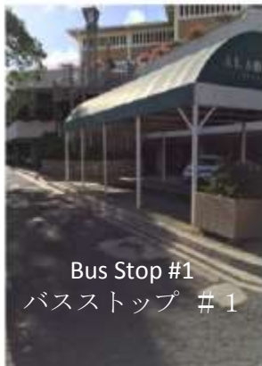
Bus Stop #1 バスストップ #1

Ala Moana Shopping Center Corner of Atkinson Dr. right by the stairs going up to Macy's アラモアナショッピングセンター アトキンソン通り側にある緑色のシャトル停留所